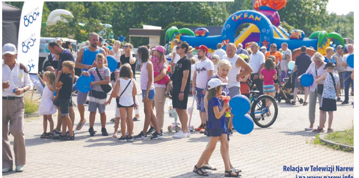
Relacja w Telewizji Narew i na www.narew.info