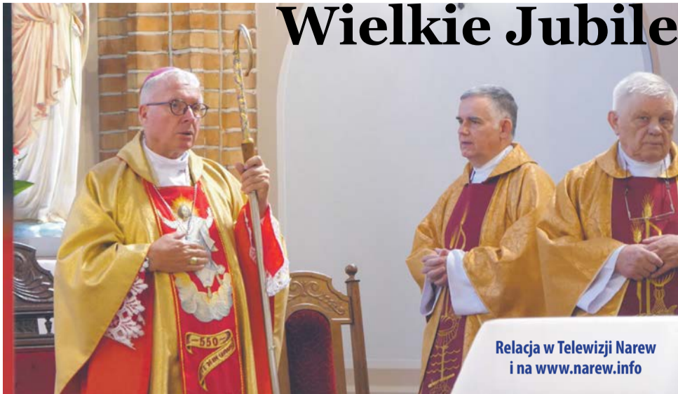
Relacja w Telewizji Narew i na www.narew.info