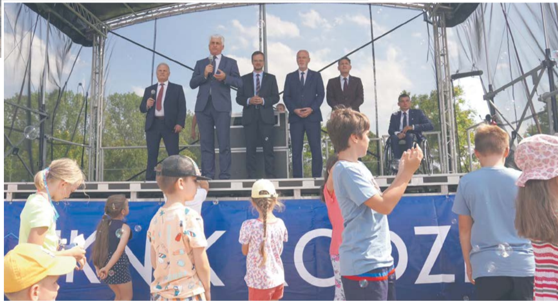
Piknik Rodzinny 800+ w Łomży był okazją do integracji młodszych i starszych członków

- Pani minister Marlena Małag prosiła o przekazanie Państwu najserdeczniejszych życzeń, ale także podziękowań za działania i wsparcie, jakie okazujecie naszemu rządowi oraz Prawu i Sprawiedliwości, naszym parlamentarzystom w tym wszystkim, co powoduje, że zmieniamy Polską rzeczywistość. 800 plus to wsparcie społeczne, które nie wprowadza żadnych podziałów – mówił z kolei radny województwa podlaskiego Piotr Modzelewski.