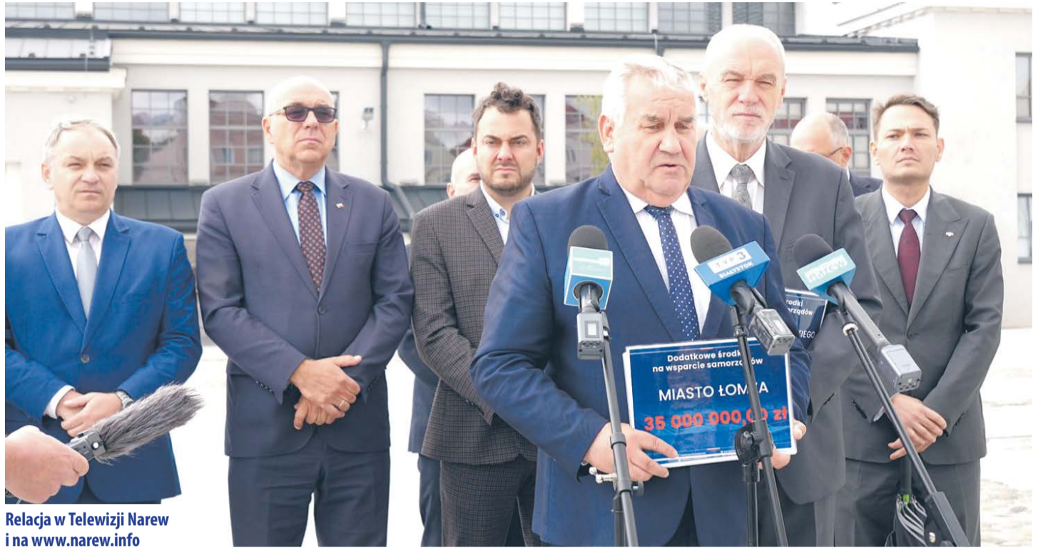
Relacja w Telewizji Narew i na www.narew.info

- To ogromne środki dla naszego miasta, szczególnie, że w poprzednich latach otrzymywaliśmy mniej niż połowę tej kwoty – podkreśla prezydent Łomży Mariusz Chrzanowski informując, że pieniądze te zostaną przeznaczone na wydatki bieżące, w szczególności na wydatki związane z wynagrodzeniem w Urzędzie Miejskim i jednostkach podległych, co jest konsekwencją podniesienia minimalnego wynagrodzenia. - Środki te też na pewno zostaną przekierowane na cele oświatowe – przekazuje prezydent Mariusz Chrzanowski, który dodaje, że zamierza aplikować o duże fundusze na infrastrukturę oświatową w ramach Polskiego Ładu.