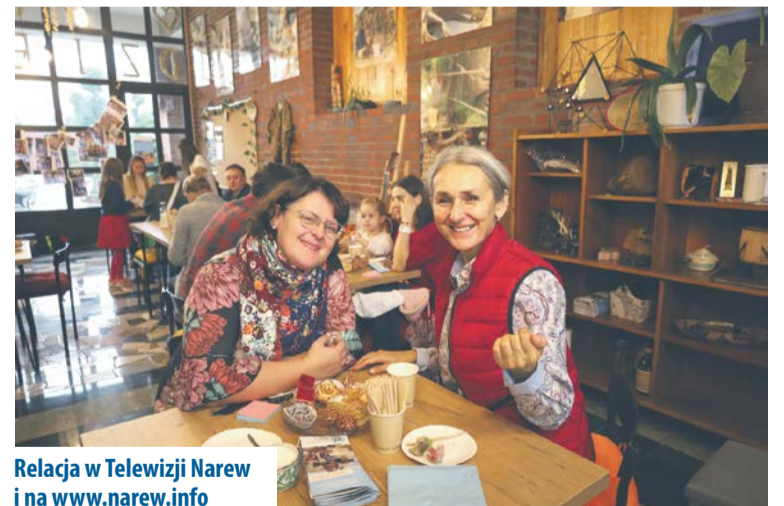
Relacja w Telewizji Narew i na www.narew.info