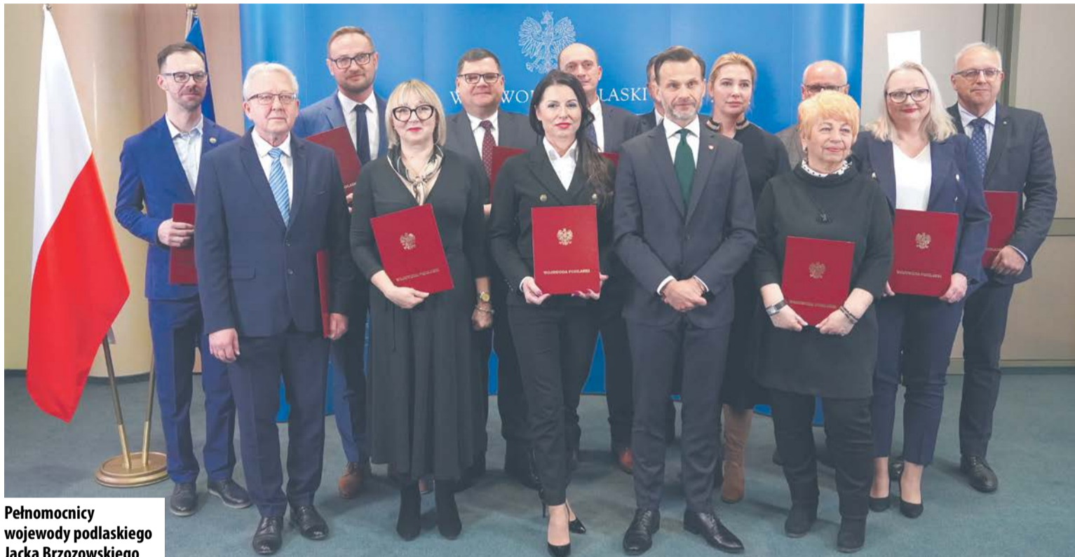
Pełnomocnicy wojewody podlaskiego Jacka Brzozowskiego

Zostali powołani następujący pełnomocnicy: