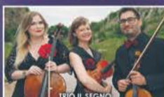
TRIO IL SEGNO