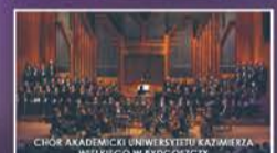
CHÓR AKADEMICKI UNIWERSYTETU KAZIMIERZA WIELKIEGO W BYDGOSZCZY