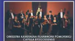
ORKIESTRA KAMERALNA FILHARMONII POMORSKIEJ CAPPELLA BYDGOSIENSIS