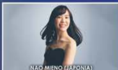
NAO MIENO (JAPONIA)