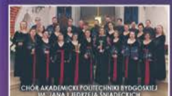
CHÓR AKADEMICKI POLITECHNIKI BYDGOSKIEJ IM. JANA JEDZEJA ŚNADKICH