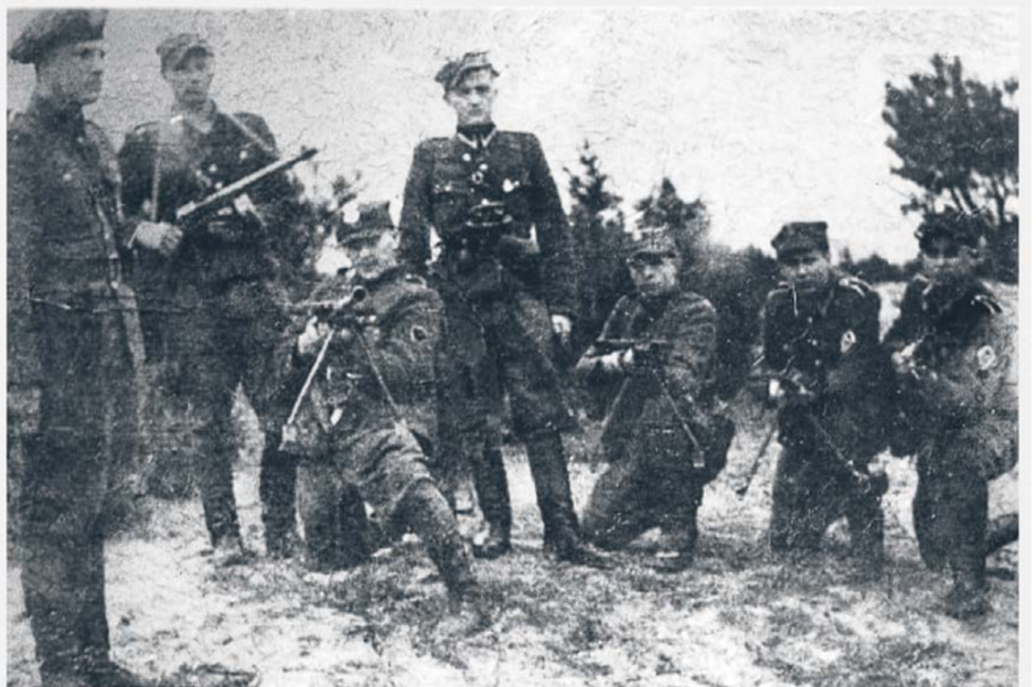
Przełom kwietnia i maja 1947 r. kolonia Tabędz Od lewej: „Konar”, „Marian”, „Wicher”, „Grom”, „Kalina”, NN, „Sokora”

W wyniku represji komunistycznych siły NZW i w ogóle podziemia na Białostocczyźnie topniały w zatrważającym tempie. O ile w 1945 r. w konspiracji i oddziałach leśnych było około 10 tysięcy żołnierzy NZW, o tyle wiosną 1947 r. w „lesie” trwała ich już tylko połowa. Największe uszczuplenie sił konspiracji spowodowała jednak tzw. amnestia. W 1947 r. skorzystało z niej przeszło kilka tysięcy żołnierzy narodowego podziemia na Białostocczyźnie. Większości z nich komuniści nie pozostawili w spokoju i w następnych miesiącach