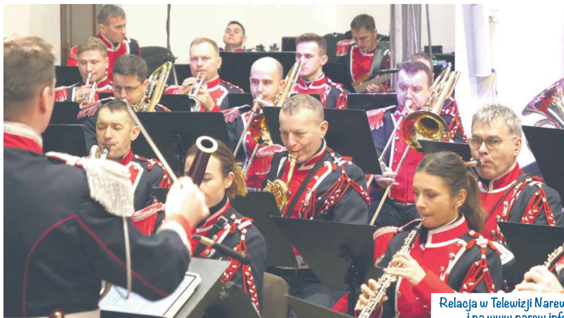
Relacja w Telewizji Narew i na www.narew.info

„Bardzo się cieszę, że kolejny rok z rzędu udało się tu w parafii pw. Świętego Krzyża wspólnie z 18. Łomżyńskim Pułkiem Logistycznym zorganizować koncert kolęd, a przy tym bardzo ważnym jest, że udaje nam się załatwić przyjazd Orkiestry Koncertowej Reprezentacyjnego Zespołu Artystycznego Wojska Polskiego. Jest to dla nas zaszczyt i jednocześnie chcę powiedzieć, że publiczność bardzo, bardzo pozytywnie te koncerty odbiera. Ludzie widzą potrzebę tych ko-