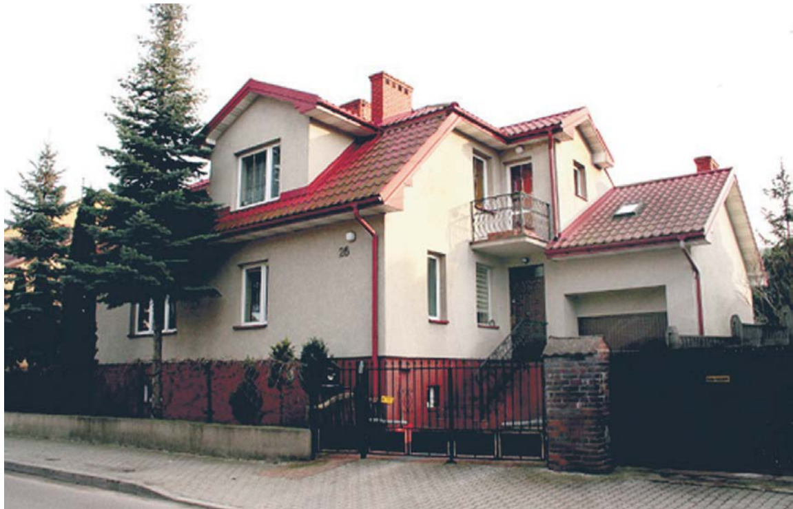
Widok naszego nowego domu od frontu...