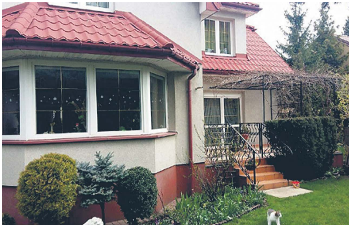
...i od strony tarasu, 2017 r.