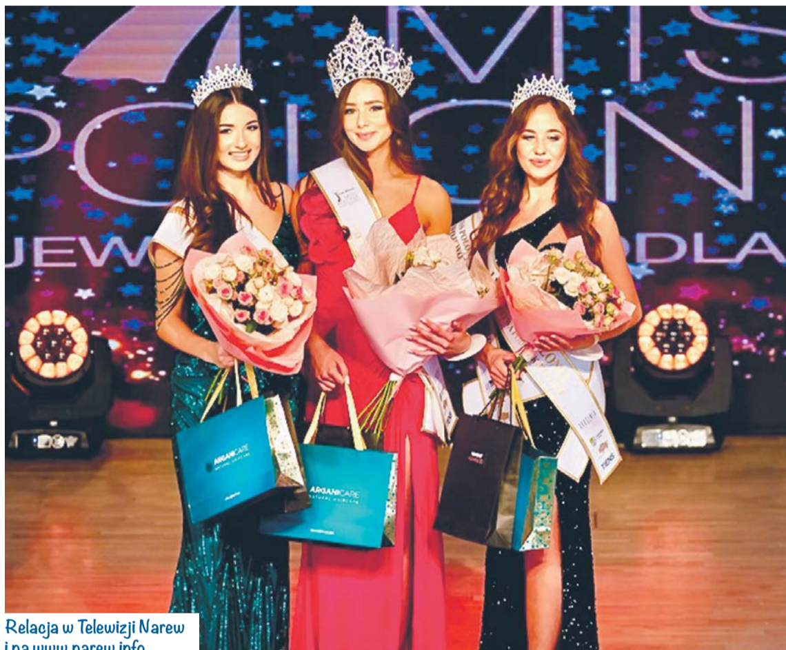
Relacja w Telewizji Narew i na www.narew.info

-To bardzo duże, ważne, a przy tym piękne- w każdym znaczeniu tego słowa- przedsięwzięcie. Jako samorząd województwa staramy się wspierać takie wydarzenia: związane z ekonomią, kulturą, sportem, turystyką czy właśnie wybory najpiękniejszych i nadawać im wymiar promocji województwa. Przy takich okazjach zachęcamy do przyjeżdżania, inwe-