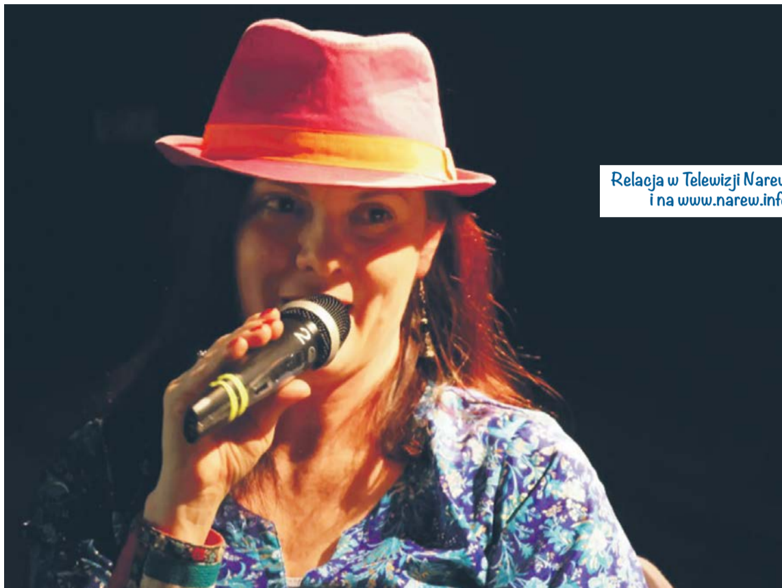
Relacja w Telewizji Narew i na www.narew.info

– Jestem bardzo wdzięczna Łomży i wszystkim ludziom, z którymi miałam tutaj do czynienia i zetknęłam się z przemiłymi osobami z Miejskiej Biblioteki. Wszystko przebiegło pięknie i dziękuję. Opowiadałam o swojej książce obyczajowo podróżniczej, o Indiach i o Sri Lance.