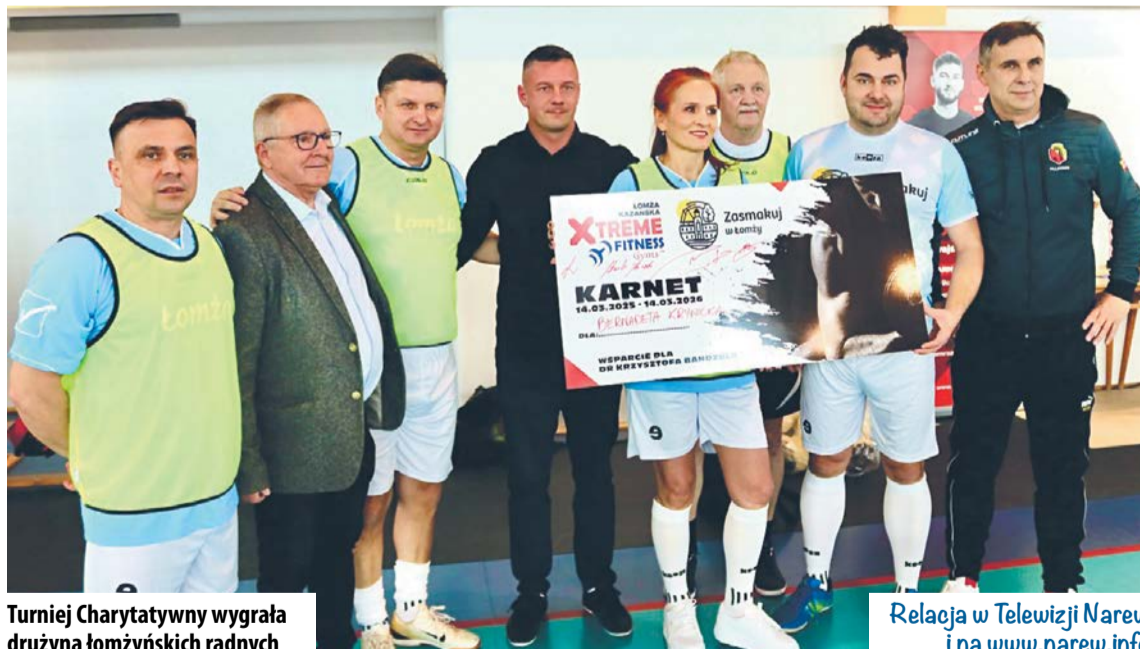
Turniej Charytatywny wygrała drużyna łomżyńskich radnych

- Jako samorząd Łomży często włączamy się w różnego rodzaju akcje charytatywne. Przeważnie są to zbiórki na leczenie dzieci, rozgrywamy też okazjonalne mecze z podopiecznymi Zespołu Szkół Specjalnych. Tym razem chcemy wesprzeć w leczeniu wspaniałego człowieka, lekarza, ojca, męża, syna, łomżyniaka, który wielokrotnie pomagał innym, a teraz sam potrzebuje naszej pomocy. Oprócz tego