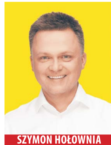
SZYMON HOŁOWNIA 79 616 głosów