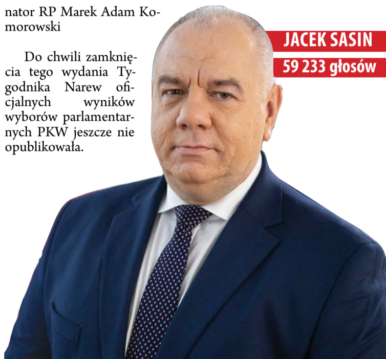
JACEK SASIN 59 233 głosów

Do chwili zamknięcia tego wydania Tygodnika Narew oficjalnych wyników wyborów parlamentarnych PKW jeszcze nie opublikowała.