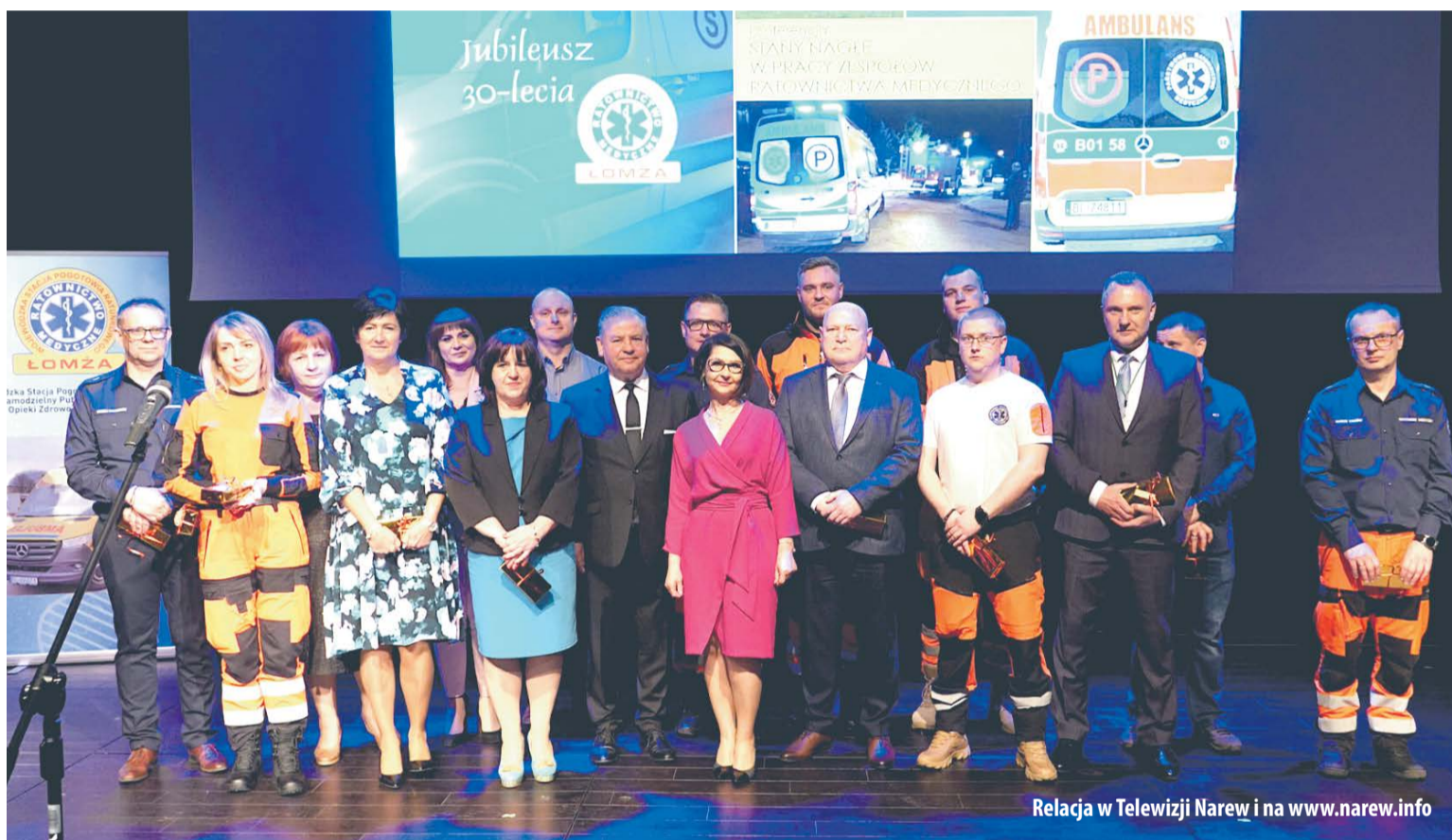
Relacja w Telewizji Narew i na www.narew.info