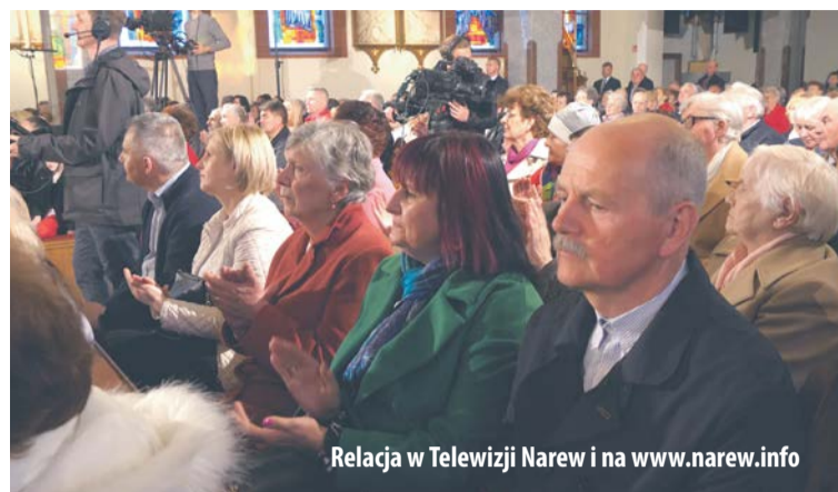
Relacja w Telewizji Narew i na www.narew.info

Jubileusz 20-lecia świętowała w poniedziałek 8 maja społeczność parafii pod wezwaniem świętego Andrzeja Boboli w Łomży.