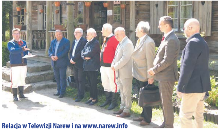
Relacja w Telewizji Narew i na www.narew.info

- Rada Skansenu to bardzo ważny organizm, który będzie wspomagać administracyjne działania samorządu województwa i dyrekcji placówki. Od czerwca ubiegłego roku, kiedy skansen został jednostką Województwa Podlaskiego, przekonaaliśmy się jak wiele wymaga pracy. Nawet takiej od podstaw, przy ratowaniu i rewitalizacji materialnej substancji "domu wszystkich Kurpiów". Od ludzi zaproszonych do rady będziemy dużo wymagać i - mam wrażenie - będziemy im wiele zawdzięczać. To profesjonalści w dziedzinie zajmowania się dziedzictwem narodowym, etnografią, kulturą, regionalizmem architekturą... Czują kulturę Kurpiów polskich, znają trendy, przepisy i estetykę kultury ludowej. Te nazwiska i osobowości są gwarancją, że bardzo poważnie podchodzimy do ratowania naszej "perły". Jestem szczęśliwy ze spotkania w takim gronie - powiedział wicemarsza-