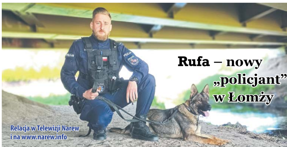
Relacja w Telewizji Narew i na www.narew.info

Decyzją Ministra Spraw Wewnętrznych i Administracji w uznaniu szczególnych zasług w zakresie ochrony bezpieczeństwa i porządku publicznego 10 policjantów otrzymało odznaki „Zasłużony Policjant”. Podczas uroczystości wręczono również medale za zasługi na niwie działalności związkowej. Medal XXX-lecia Niezależnego Samorządnego Związku Zawodowego Policjantów otrzymało 5 funkcjonariuszy. Szef podlaskich policjantów wraz z zastępcami wyróżnił również dwoje funkcjonariuszy za wzorowe wykonywanie obowiązków służbowych w swojej wieloletniej służbie. Dodał, że „są oni bez wątpienia wzorem do naśladowania dla młodszych stażem kolegów, ale przede wszystkim dla funkcjonariuszy, którzy dzisiaj ślubowali”.