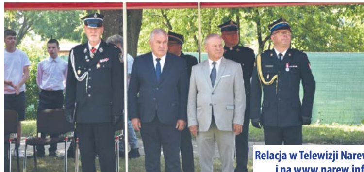
Relacja w Telewizji Narew i na www.narew.info

Orkiestra, sztandary i wszyscy uczestnicy uroczystości prze-