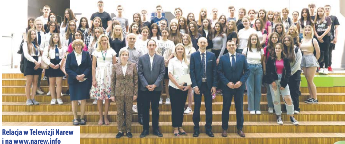
Relacja w Telewizji Narew i na www.narew.info

czącą spożywania owadów. Trzy tysiące grup etnicznych na naszej planecie (dwa miliony ludzi) ma w swoim jadłospisie owady, konkretnie konsumuje ponad dwa tysiące ich gatunków. Na starym kontynencie kwestie spożycia owadów reguluje EFSA, czyli Europejski Urząd ds. Bezpieczeństwa Żywności: to właśnie ta instytucja decyduje o wprowadzeniu do wykazu tzw. nowej żywności (novel foods) kolejnych gatunków owadów. W Unii Europejskiej dopuszczonych do konsumpcji są cztery gatunki owadów, kolejne czekają na rejestrację. Za spożywaniem owadów przemawiają względy ekonomii i ekologii: w 2050 roku światowa populacja ludzi przekroczy dziesięć miliardów, zapotrzebowanie na białko