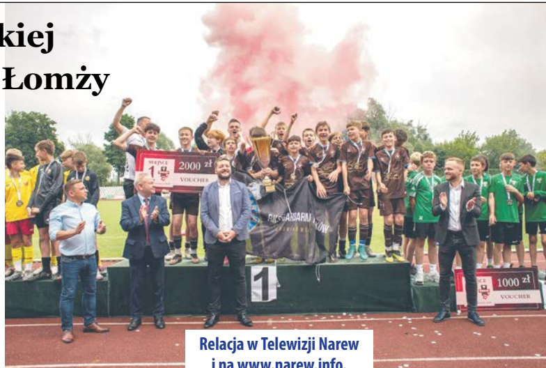
Relacja w Telewizji Narew i na www.narew.info .

Łomża Cup dla młodych adeptów futbolu to przedłużenie