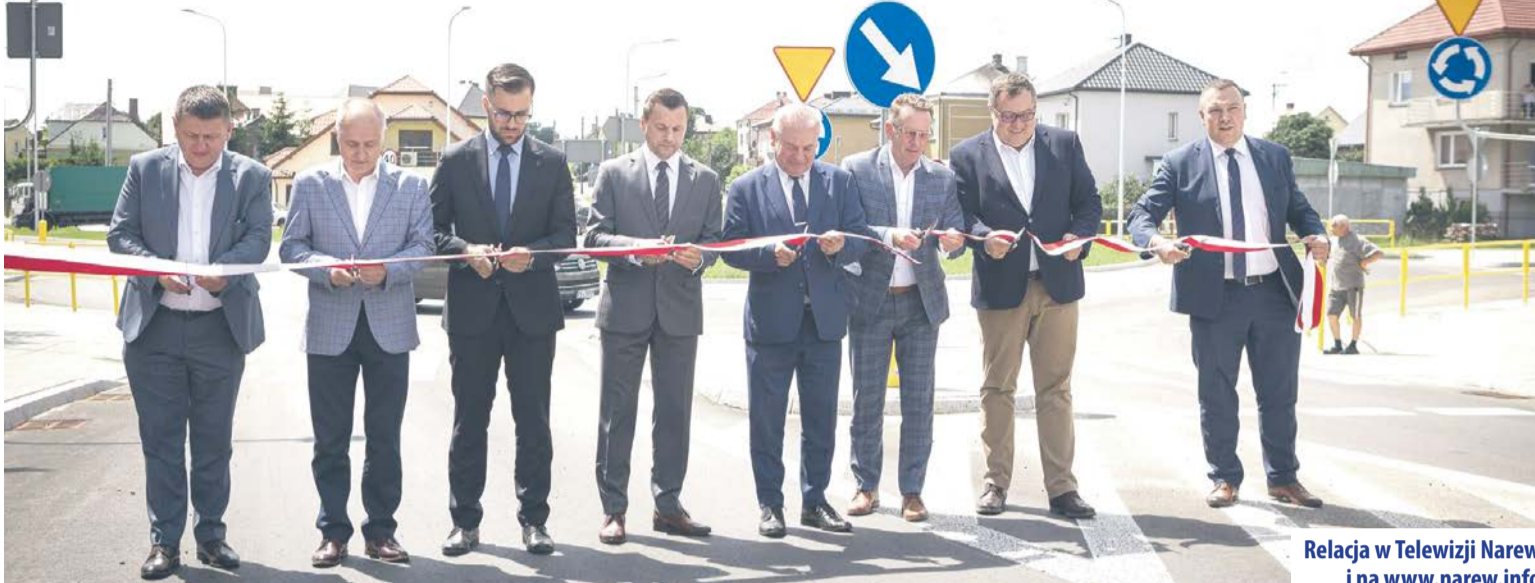
Relacja w Telewizji Narew i na www.narew.info

– Dwa miesiące temu podpisaliśmy umowę na wykonanie projektu ścieżki rowerowej na