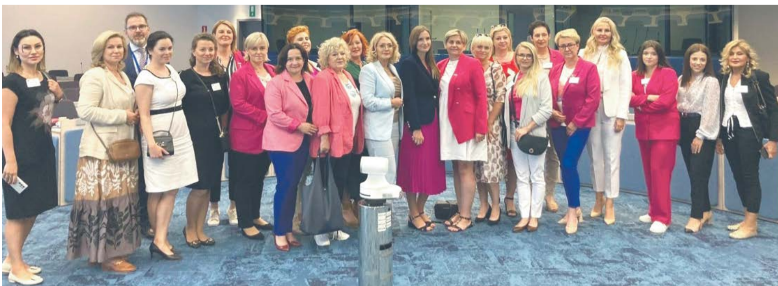
Lokalne liderki Stowarzyszenia Kobiety w Centrum i lokalni dziennikarze między panelami eksperckimi w Komisji Europejskiej w Brukseli

A.Z: - Bo każda kobieta powinna znaleźć czas dla siebie, na swój rozwój osobisty, a co więcej zachęcić do tego tą drugą. Będzie to bardzo kobiece wydarzenie, które pokaże, że można żyć inaczej. Bo kobieta jest szczęśliwa wtedy, kiedy przestaje się bać. Dlatego drogie Panie 20 października przestajemy się bać co ludzie powiedzą i widzimy się w Białymstoku. Do zobaczenia!