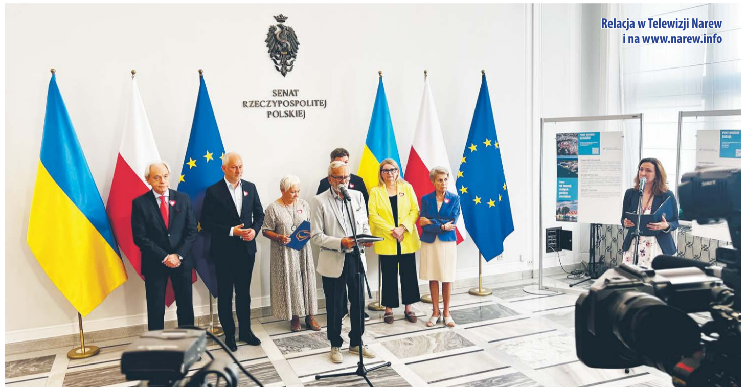
Relacja w Telewizji Narew i na www.narew.info

- Jesteśmy konsekwentni i spełniamy obietnicę, która padła podczas wystąpienia publicznego przy tzw. ustawie Lex pilot. Prawie wszystkie telewizje lokalne przyjechały wtedy na to spotkanie i mó-