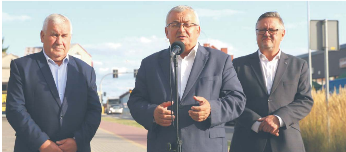
Od lewej poseł Kazimierz Gwiazdowski, minister Andrzej Adamczyk i burmistrz Andrzej Duda

Celem inwestycji jest budowa nowoczesnej i bezpiecznej infrastruktury drogowej, poprawa bezpieczeństwa ruchu dro-