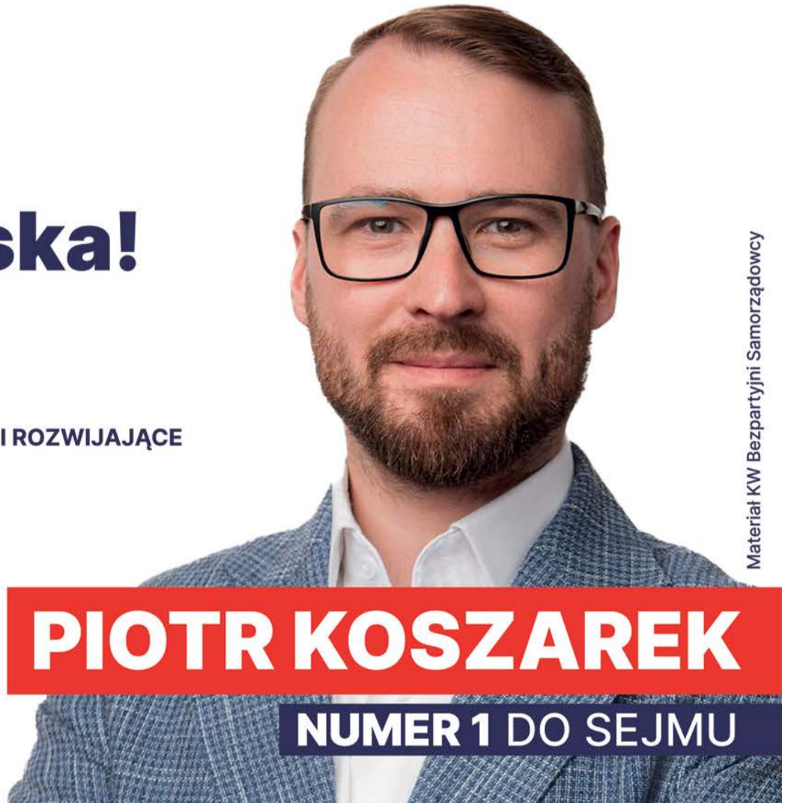
Materiał KW Bezpartyjni Samorządowcy