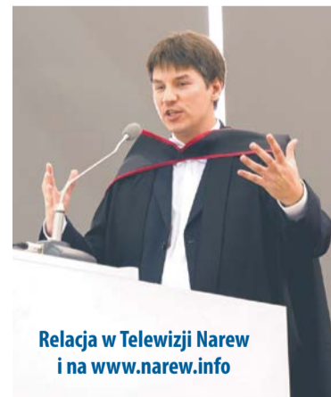
Relacja w Telewizji Narew i na www.narew.info