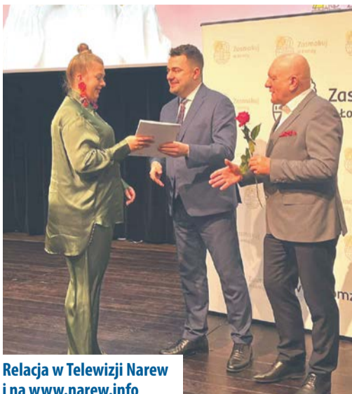
Relacja w Telewizji Narew i na www.narew.info

Celem Łomżyńskiej Rady Kobiet jest integrowanie, wspieranie i reprezentowanie środowiska kobiet, poprzez aktywną współpracę z władzami Miasta Łomża. Podobnie jak inne, działające w mieście społeczne rady, ma ona charakter opiniotwórczy i konsultacyjny.