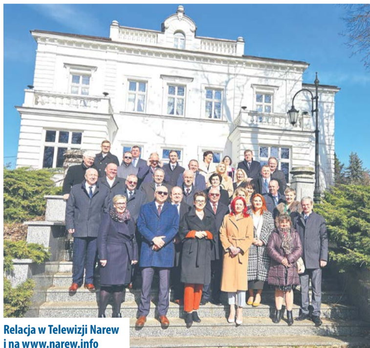
Relacja w Telewizji Narew i na www.narew.info