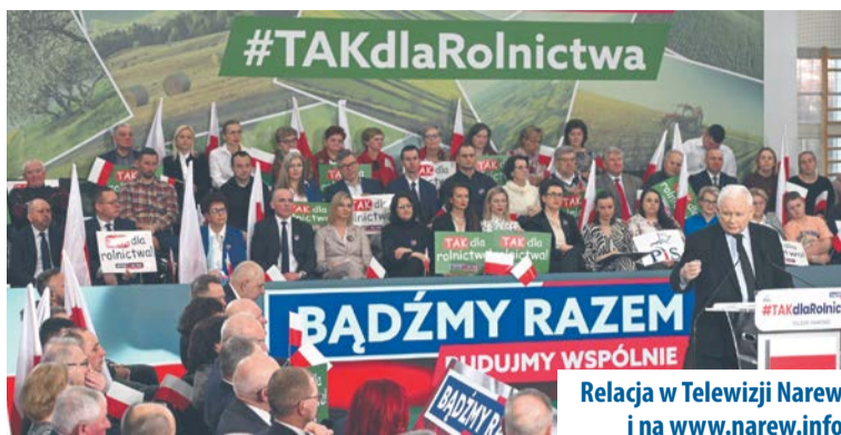
Relacja w Telewizji Narew i na www.narew.info

- Myśmy nie mieli żadnych oporów, kiedy się okazało, że trzeba zatrzymać import zboża z Ukrainy w kwietniu zeszłego roku, czyli już prawie rok temu. We wsi Łyse mówiłem, że to zrobimy i zrobiliśmy - podkreślił prezes PiS.